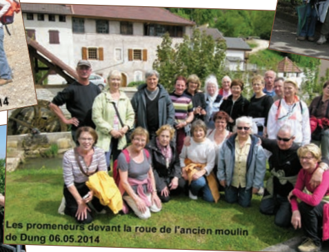
Les promeneurs devant la roue de l'ancien moulin de Dung 06.05.2014