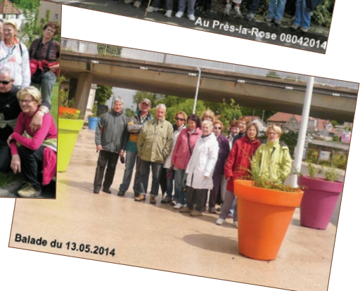
Balade du 13.05.2014