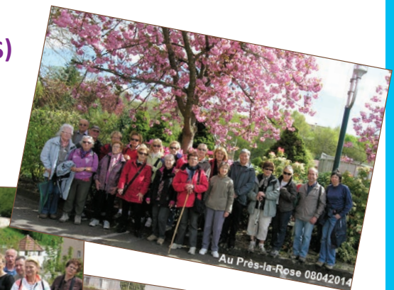
Au Prés-la-Rose 08.04.2014