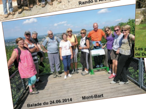
Balade du 24.06.2014 Mont-Bart