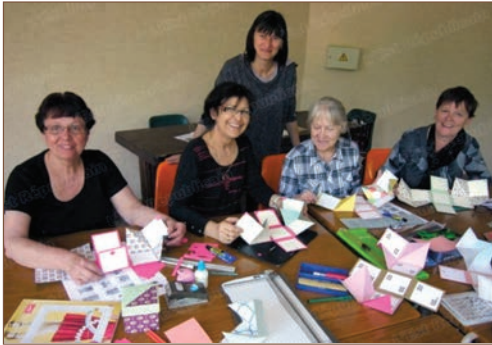
Fabrication de mini-albums

Quant aux peintres, ils ont suivi minutieusement les conseils prodigués par Viviane BARBIER et Michel KOCH pour réaliser des bouquets champêtres avec des iris.