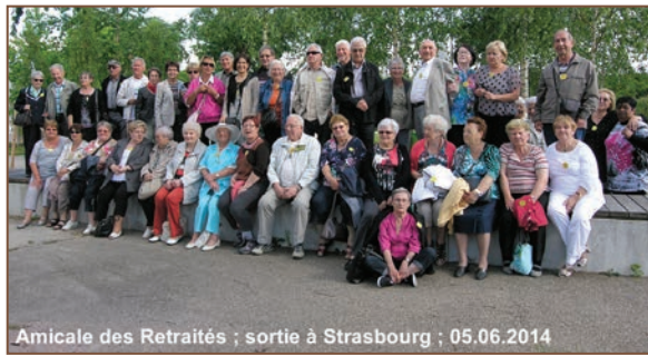
Sortie à Strasbourg