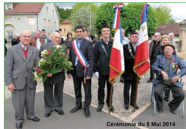
Cérémonie du 8 Mai 2014