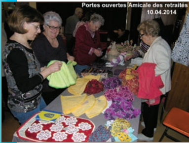
Portes ouvertes de l'amicale