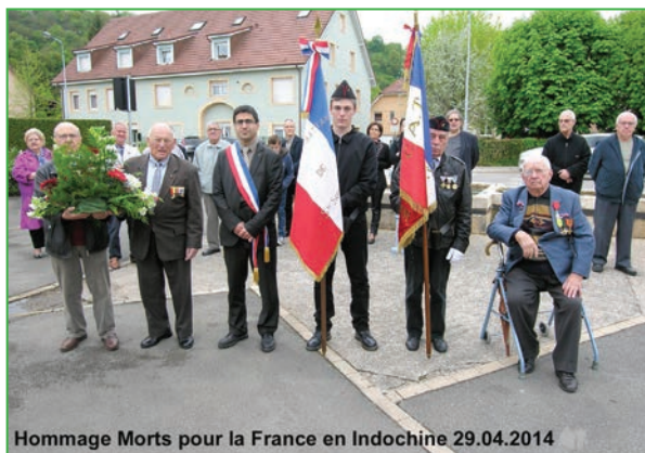
Hommage Morts pour la France en Indochine 29.04.2014