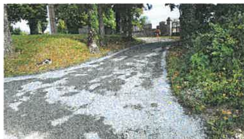
Réfection des accès au cimetière