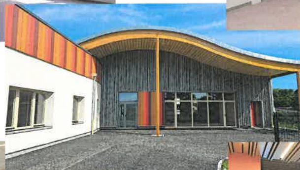
COUR - PRÉAU