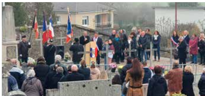
Cérémonie du 17 novembre, libération de Bart